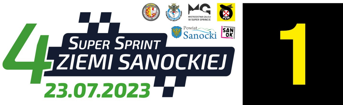
Reklama dodatkowa B